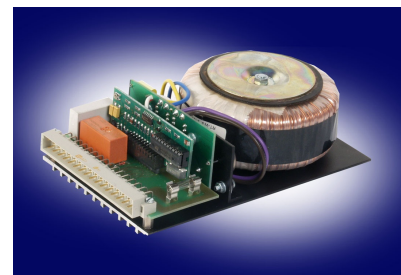
HGRW 60 VA