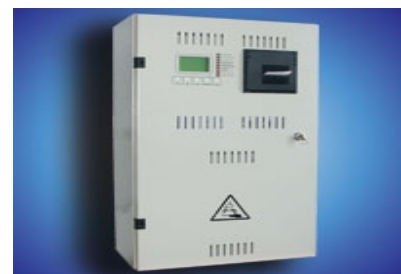
HBK 612.4 Option Drucker